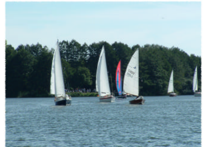
Kanalausfahrt aus dem Hagenburger Kanal

Laser, HobieCat, TopCat, H-Jolle, P-Boot, Varianta, Neptun, Jantar u.s.w.