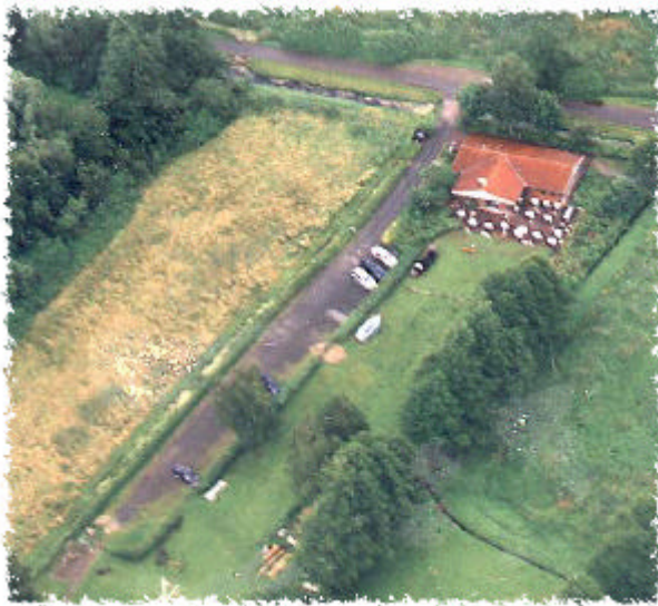
Das Clubgelände aus der Luft